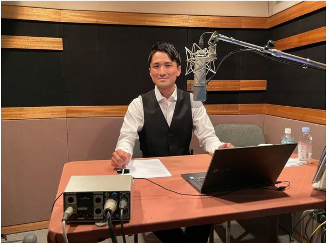
FM横浜のラジオ番組「Change Your Life」に3週間連続で出演しました。